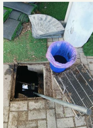
安平遊碼水溝清淤