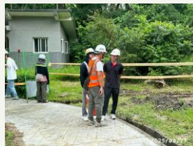
水映南瀛虎頭埤生態及人文教育園區營造計畫-環教景觀暨步道-第一標(新化區)