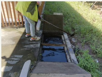
小美軍排水溝清淤