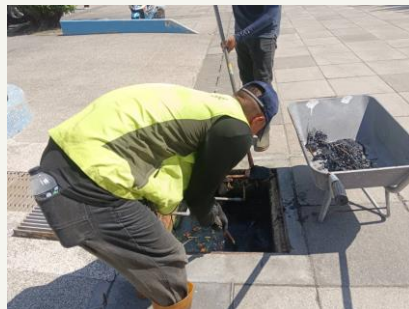
黃金海岸廊帶公園水溝清淤