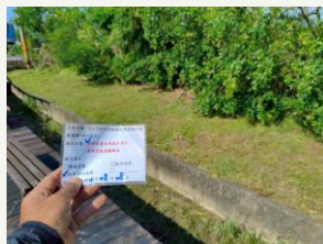
路東橋旁遊憩碼頭