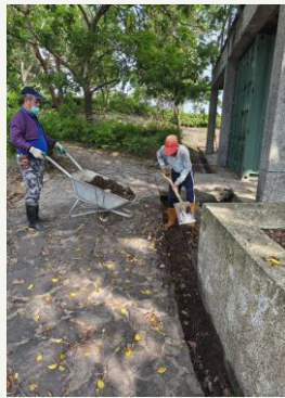
虎頭埤風景區公廁水溝清淤