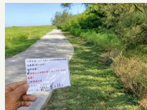
喜樹至小美軍沙灘PC刷毛步道