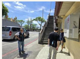
台江十六寮街區走讀導覽解說牌設置工程(安南區)